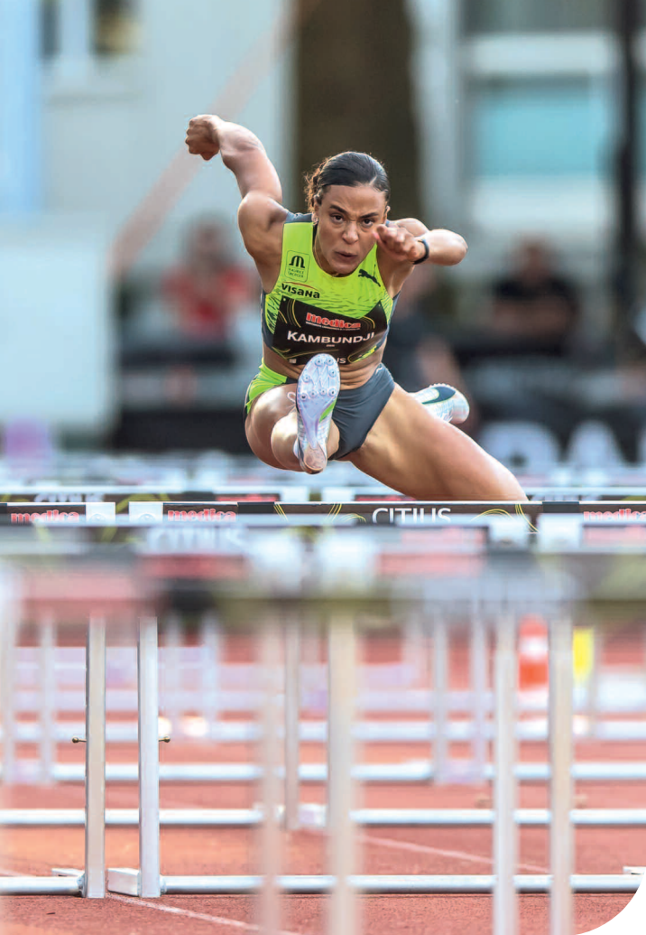
Visana-Botschafterin Ditaji Kambundji tritt über die Hürden an.